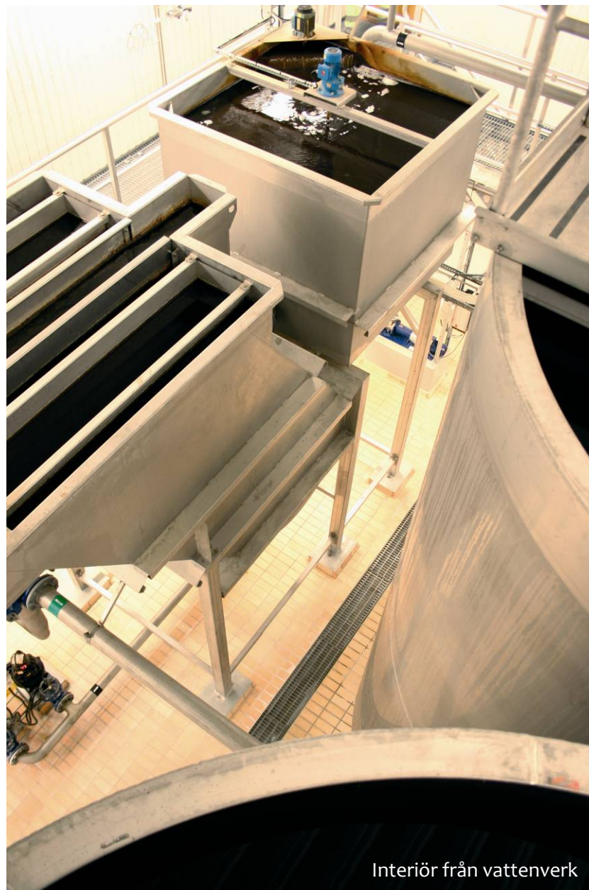
Interiör från vattenverk

En tillgänglig samhällsservice har betydelse för medborgarnas upplevelse av en trygg och attraktiv livsmiljö. Den ger också förutsättningar för mötesplatser och ett aktivt deltagande i samhällslivet. Kommunens målsättning är därför att, så långt det är möjligt, bibehålla den kommunala servicen på de orter där den finns idag. En förutsättning för att kunna behålla samhällsservicen på en god nivå är att den vikande befolkningstrenden ändras.