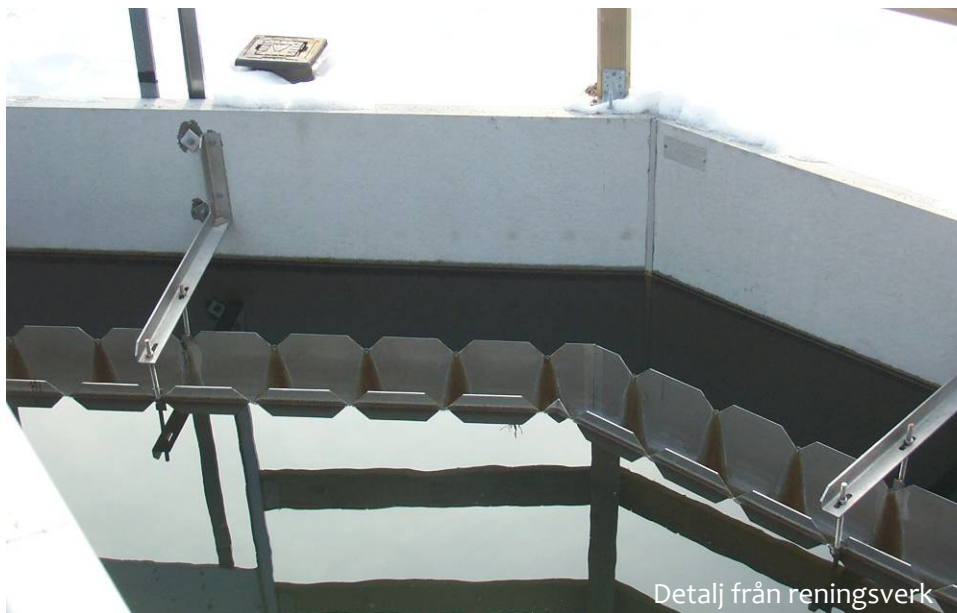
Detalj från reningsverk

Kommunen ska informera allmänheten om vilka regler och föreskrifter som gäller vid till exempel biltvätt.