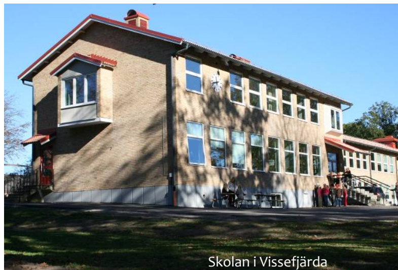
Skolan i Vissefjärda

Långsiktig planering bör användas för att kunna erbjuda en trygg skoltid, där lokaler och utomhusmiljöer är väl anpassade för sitt ändamål.