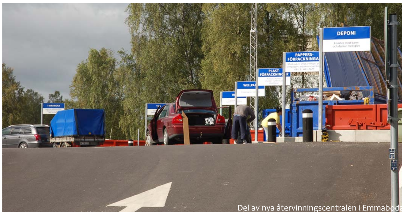
Del av nya återvinningscentralen i Emmaboda

Vissa av de befintliga lokaliseringarna är i behov av översyn av olika skäl. Viktiga aspekter att ta hänsyn till i arbetet med lokaliseringen av återvinningsstationer är buller, framkomlighet vid tömning, visuellt intryck, avstånd i upptagningsområdet och tillgänglighet för användare.