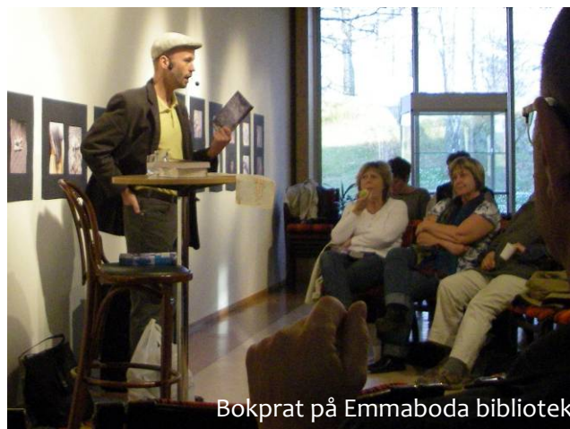
Bokprat på Emmaboda bibliotek

Huvudbiblioteket är placerat i Emmaboda. Där finns också ett skolbibliotek på Bjurbäckskolan. Övriga bibliotek i kommunen ligger i Boda Glasbruk, Eriksmåla, Broakulla, Lindås, Långasjö och Vissefjärda.