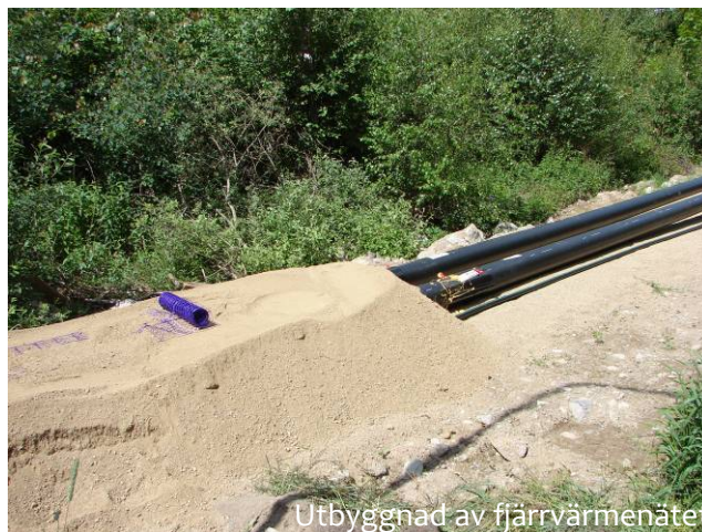
Utbyggnad av fjärrvärmenätet

Emmaboda kommun strävar efter en total täckning av det mobila telenätet, inom hela kommunen, med marginella undantag.