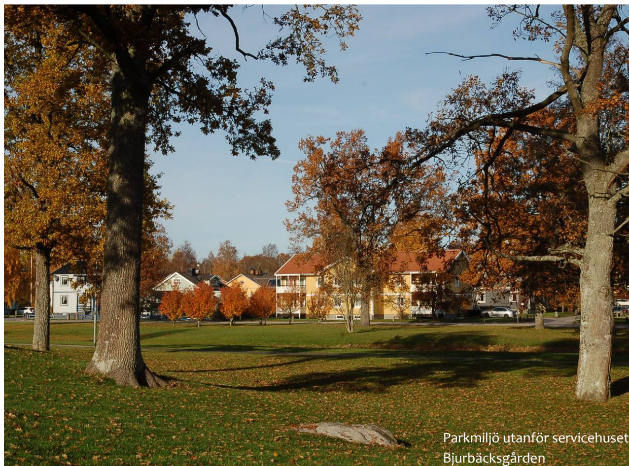
Parkmiljö utanför servicehuset Bjurbäcksgården

Emmaboda kommunen har en socialtjänstplan som innehåller en tydlig värdegrund för verksamheten i kommunen.