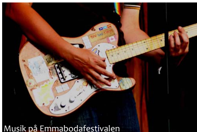
Musik på Emmabodafestivalen

Besöksnäringen i Emmaboda kommun producerar varor och tjänster för såväl besökaren som kommuninvånaren och domineras av småföretagare. Kommunen arbetar med att utveckla reseanledningar, det vill säga platser, besöksmål eller evenemang som gör att människor vill besöka vår kommun. Reseanledningarna kan vara i form av evenemang och paket för att också förlänga säsongen. För att nå resultat arbetar kommunen med att identifiera målgrupper och ta fram teman som Glas, Kultur & Design, Natur & äventyr, Det goda livet och Familjeupplevelser . Vissa företag och besöksmål, som är av hög kvalitet och skapar publicitet med ökat intresse för området, är så kallade profilbärare i kommunens besöksnäring.