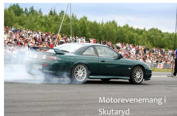
Motorevenemang i Skutaryd