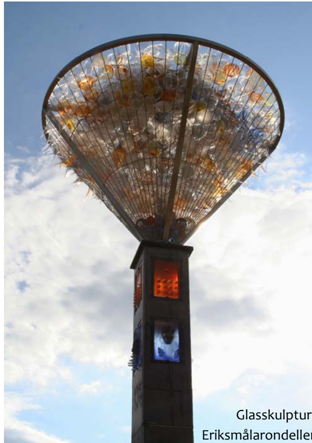
Glasskulptur i Eriksmålarondellen

Musikfestivalen är det största av flera evenemang i kommunen. Musikfestivalen lockar flera tusen besökare varje sommar och har blivit ett evenemang som sätter Emmaboda på kartan. Målgruppen är främst ungdomar och kan därför vara en användbar arena för att sprida Emmabodas varumärke inför framtiden. Att utveckla och samverka kring våra evenemang är en strategisk fråga för att nå framgång.