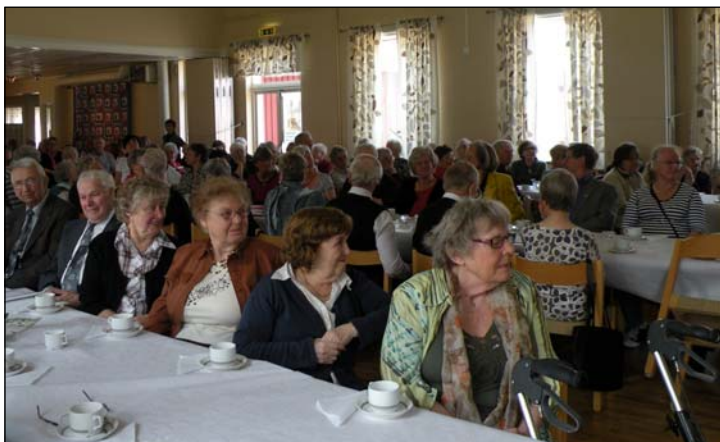
Fullsatt i Ladan då det var modevisning,