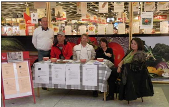
IFO-enheten informerar om kommunens råd & stöd i Köpstaden.