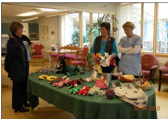
Lokala konsthantverkare visar sin alster på Rönningegården.