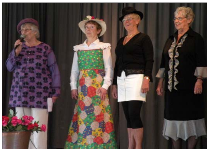
av nya kläder från Sol & Vindar