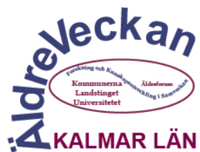
Foto från Äldreveckan 2010