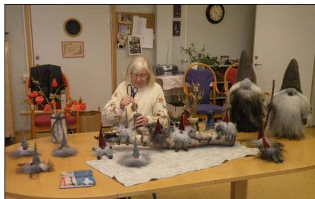
Hantverk visas på Rönningegården.