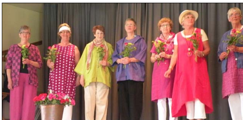
och av bättre begagnade kläder från Kupan.