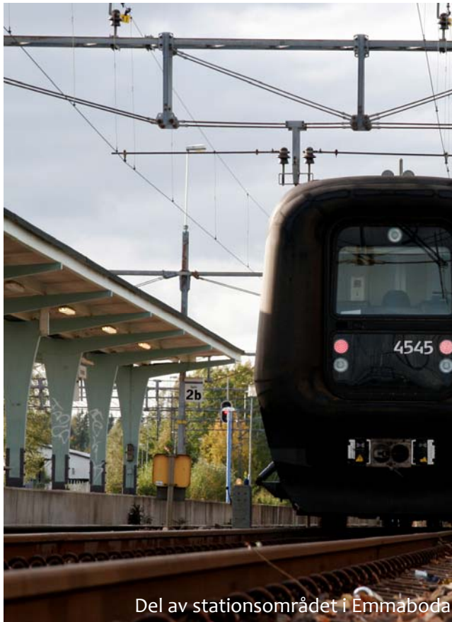
Del av stationsområdet i Emmaboda

Kust till kustbanan enligt beslut Trafikverket 2011-11-23. Motivering: ”Kust till kustbanan är av interregional betydelse. Banan sträcker sig från Göteborg till Kalmar samt Karlskrona via bland annat Borås, Värnamo och Alvesta. Banan trafikeras av gods- och persontåg.”