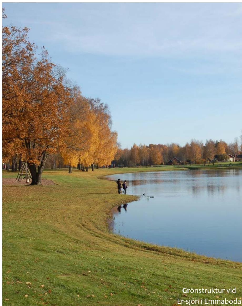
Grönstruktur vid Er-sjön i Emmaboda

Det finns olika sorters grönstrukturer inom tätorterna i kommunen. En grönstruktur som är väl integrerad med ortens övriga strukturer kan bidra till attraktivitet, hållbar tillväxt och ökad välfärd. Översiktsplanen föreslår att vissa områden med grönstruktur förädlas för att skapa attraktiva miljöer för invånare. Genom att samordna grönstrukturarbetet med åtgärder för att motverka framtida översvämningar och vattenkvalitetshöjande åtgärder kan kostnadseffektiva lösningar genomföras. Det finns också förslag i översiktsplanen som tar förädlad grönstruktur i samhällena i anspråk för nybyggnation av attraktiva bostäder. Den allemansrättsliga passagen vid stranden och tillgången på förädlad grönstruktur i samhällena kommer vid nybyggnation också att tillgodoses eftersom dessa intressen går hand i hand med varandra. Nybyggnationen är inte lika attraktiv utan den förädlade grönstrukturen med gångstråk, bänkar och liknande runt vattenområden.