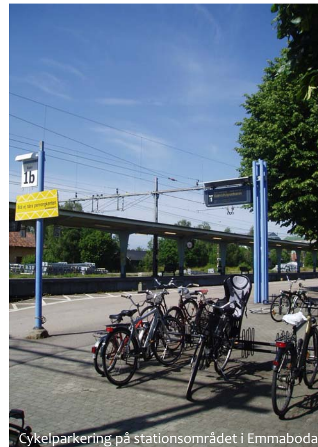
Cykelparkering på stationsområdet i Emmaboda

I kommunen finns idag många relativt smala vägar som belastas av tung trafik till sågverk och andra industrier. Översiktsplanen pekar ut de vägar som kommunen prioriterar i en upprustning för att möta dagens trafikbelastning och för att minska olycksriskerna.