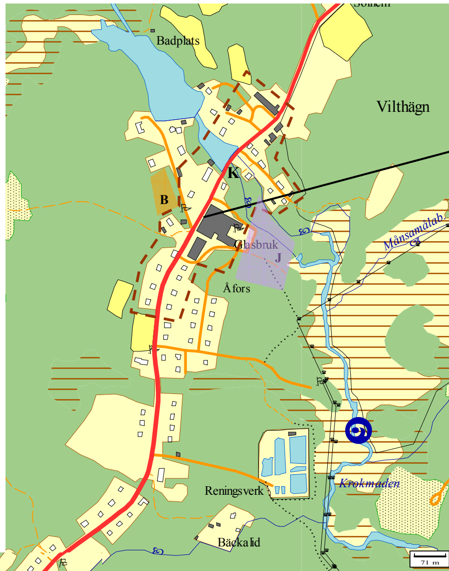
Åtgärd: Upphöjd gångbana utanför glasbruket.