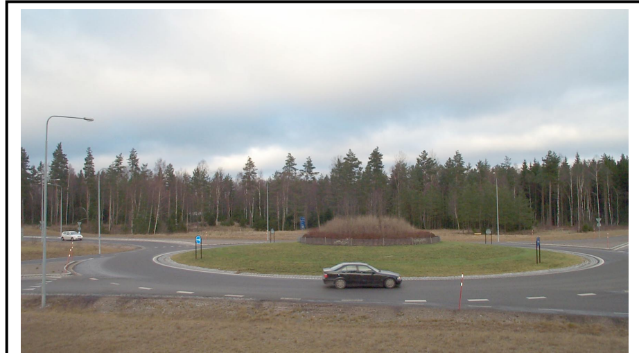
Befintlig Rondell vid Eriksmåla Åtgärd: Tydliggöra entréerna till samhällena Eriksmåla-Åfors