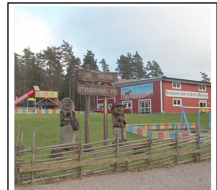
Eriksmåla Jakt- och Fiskemuseum