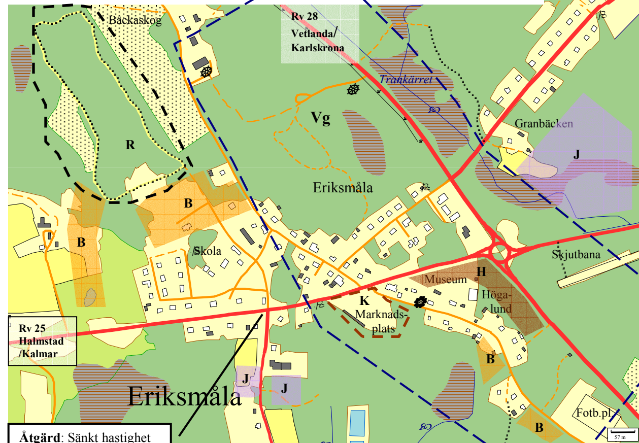
Åtgärd: Sänkt hastighet till 50 km/h.