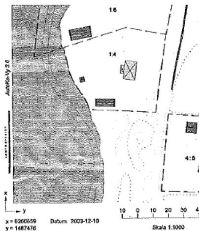
3. Fastighetskarta 2003